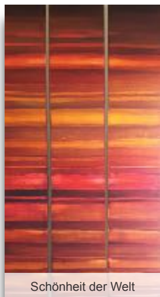
Schönheit der Welt

Musikalisch wird der Gottesdienst von den Young Voices begleitet.